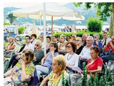
Il pubblico numeroso ieri pomeriggio alla Como Nuoto