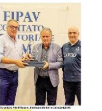
Premiazione del volley comasco.

La Sera di premiazione del volley comasco ha richiamato centinaia di appassionati a Erba. E per il terzo anno il movimento avrà due squadre in A2.