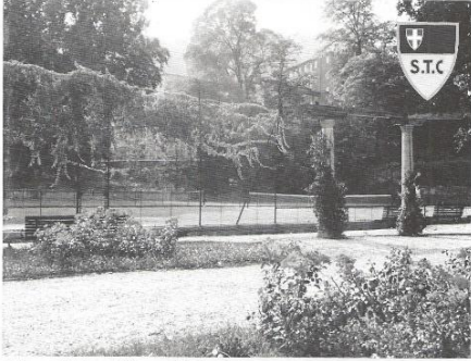
Ritorno ore 20.00 presso il Ristorante della "Società Tennis Como", via Cantoni 1, Como - Tel:031-57.31.00