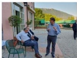
Circolo Tennis Como - 8 giugno 2023 - Conviviale

"Tennis Como, il circolo: ieri, oggi e domani"