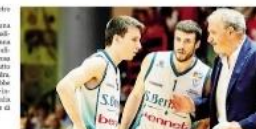
Giocatori di basket in azione.