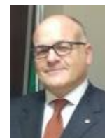
di Diego Vecchiato

San Donà di Piave nell'area della Città Metropolitana di Venezia è oggi terza per numero di abitanti dopo Venezia e Chioggia e la sua "popolazione sportiva" è parimenti rilevante, per numero di praticanti e qualità di risultati, grazie anche ad una dotazione di impianti sportivi certamente significativa.