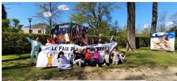
Visite guidée de l'expo à Woluwe-Saint-Pierre