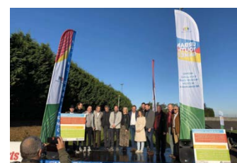
Cérémonie d'ouverture de la journée