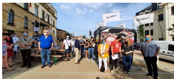
Vernissage de l'exposition « l'Esprit du Sport » à Arlon