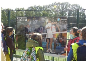
Visite guidée de l'expo à Woluwe-Saint-Lambert

Dès lors, en 2021, ce sont plus de 15 entités qui ont fait vivre « l'Esprit du Sport » sur leurs terres afin de diffuser les valeurs du sport. Lors de chaque exposition, un vernissage est organisé afin d'y mêler les différents publics de l'entité et démontrer la dimension sociétale du Fair-Play. Voici ci-dessous la listes des entités ayant utilisé et accueilli l'exposition : la ville de Wavre - la ville d'Arlon - la commune de Woluwe-Saint-Pierre - la commune de Profondeville - la commune de Woluwe-Saint-Lambert - le Tennis club de Bois-de-Villers - le Royal Excelsior Sports Club de Bruxelles - la commune d'Anderlecht - les Urban Youth Games à Waremme et Molenbeek - la commune d'Ans - la commune de Rixensart - La commune de Fléron - la commune de Koekelberg et la commune de Watermael-Boitsfort.