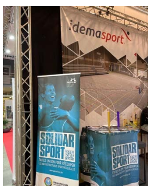
Stand du Panathlon Wallonie-Bruxelles à Municipalia

Le 30 septembre et 1er octobre 2021, s'est tenu le salon Municipalia au Wex de Marche-en-Famenne. Une occasion pour notre association de rencontrer les entités membres et non membres, ainsi, que cette année faire la promotion de la campagne SolidarSport, détaillée plus haut. De plus chaque fédération sportive présente a reçu la nouvelle banderole « Le Fair-Play est Un Sport » (cfr ci-dessous) ainsi qu'un drapeau montrant le pictogramme s'essayant à leur sport respectif.