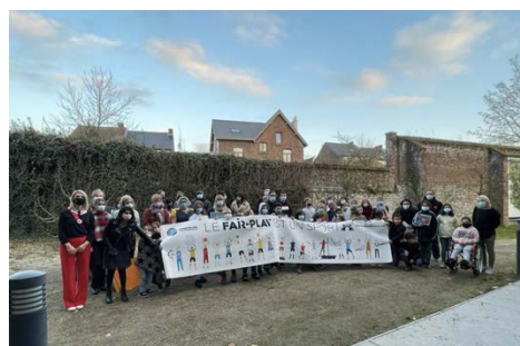
Remise des prix au Musée de la Photographie de Charleroi

Les créateurs des œuvres les plus originales se sont vus remettre un prix le 24 novembre.