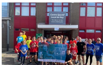
Passage des 1000km du Fair-Play au Centre Sportif Local de Huy

La formule de ces « 1000 km du Fair-Play » a reposé sur un maillage solidaire, à travers Bruxelles et la Wallonie. A pied ou à vélo, valides et moins valides, sportifs professionnels ou amateurs ont été à leur rythme pour relier les villes et communes membres du Panathlon Wallonie-Bruxelles (ainsi que certaines entités fortement touchées comme Pepinster) afin de déjà dispatcher une partie du matériel sportif récolté ou directement acheté avec les dons financiers reçus, en fonction des inventaires reçues au préalable.