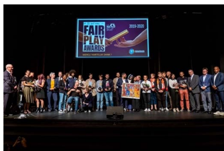
Les lauréats de l'édition 2019-2020