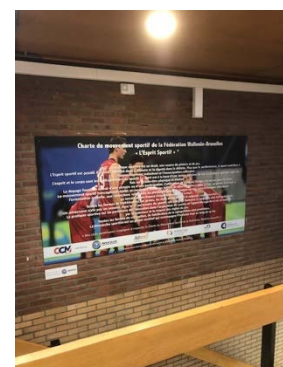
Charte du Fair-Play placée au centre sportif Cardinal Mercier de Braine-l'Alleud