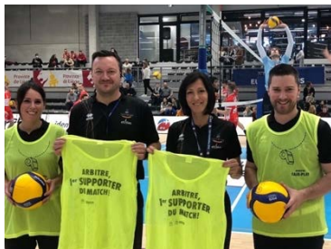
Arbitres de volleyball participant à la campagne

Pour démarrer la campagne par une action forte, ambitieuse et générique, ce sont plus de 3000 arbitres officiels ou « de club » qui ont officié sur des centaines de terrains en portant une chasuble floquée du message de la campagne. La campagne verra les actions de terrain se démultiplier pour mettre en avant ces arbitres en tant que fondations solides de la pratique sportive et maillons essentiels pour la transmission de valeurs. Les arbitres sont les gardiens du feu, celui de la passion. Les officiels du sport sont les garants du respect des normes, ils se démultiplient pour que sportifs, encadrants et spectateurs vivent une expérience sûre, positive et agréable. De par leur rôle et leur passion pour leur sport, ils supportent les joueurs dans leur éducation à des valeurs sociétales, afin de créer cette atmosphère sportive sur et en dehors des terrains que nous aimons tant et qui fédère les acteurs de la vie sportive.