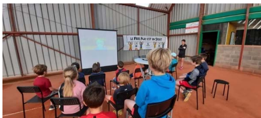
Animation Fair-Play au Tennis Club de Bois-de-Villers

Dans le cadre de stages sportifs, de journées sportives ou directement dans les écoles, l'association développe des animations pour aborder les valeurs citoyennes de notre société, et ce grâce au sport. Le serment du Fair-Play, l'hymne du Fair-Play ou encore les vidéos de nos cinés Fair-Play sont quelques ingrédients qui amènent la jeune génération à réfléchir sur l'importance des valeurs sur et en dehors du terrain.