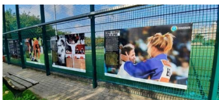
L'exposition placée à la journée de Molenbeek

Les Urban Youth Games, dont le Panathlon Wallonie-Bruxelles est partenaire, ont déployé les valeurs du sport à Molenbeek et Ans en ce mois d'octobre. Le Fair-Play et l'Inclusion par le sport sont au centre de ces journées sportives où les enfants peuvent s'essayer à plusieurs sports !! Et réciter le serment du Fair-Play en début de journée ainsi que de visiter l'exposition « l'Esprit du Sport ». Au total ce sont près de 1500 enfants qui ont pris part à ces journées sportives d'inclusion.