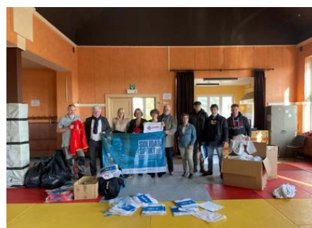
Remise de matériels sportifs aux clubs de foot, judo, karaté et basket à Pepinster

pour les clubs d'Ottignies Louvain-La-Neuve, de Vielsalm, d'Aywaille et de Pepinster, des kimonos et des pattes d'ours pour les clubs de judo, de karaté et de Jiu-Jitsu de Pepinster, un trampoline et des vélos pour le complexe sportif de Wanze, 200 chasubles pour le club de foot d'Auvélais. Et l'opération continuera bien entendu en 2022.