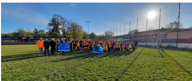
Remise de matériels sportifs au club de foot du RUS Auvélais

Et à l'heure actuelle, ce sont 16 clubs et complexes sportifs dans 7 communes différentes (Auvélais, Aywaille, Hêlécine, Ottignies-Louvain-la-Neuve, Pepinster, Sambreville, Vielsalm et Wanze) qui ont déjà pu bénéficier de ces dons (sur base des inventaires des pertes subies transmis par ces entités). Passant par la distribution de ballons de volley et de basket au complexe sportif d'Hêlécine, des ballons de foot pour le club de Pepinster, des filets de tennis