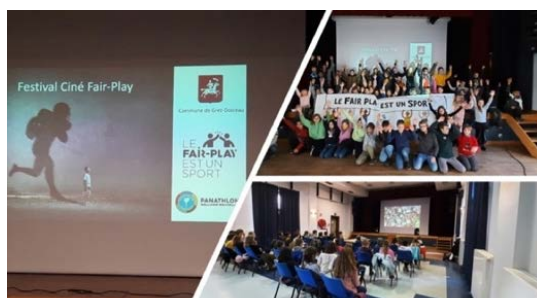
Cinés Fair-Play à Grez-Doiceau