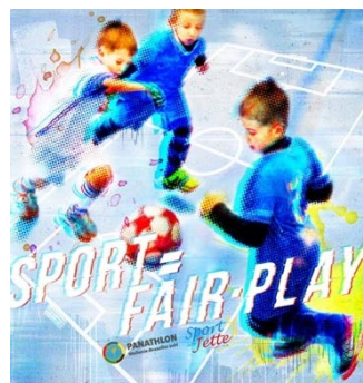
Lettrage Fair-Play placé sur les vitres du hall omnisport de Jette